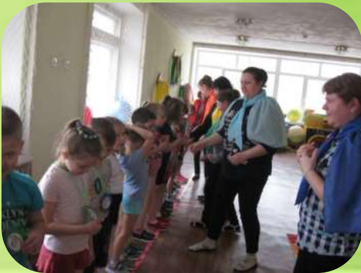
Спортивный праздник «Здравиада»