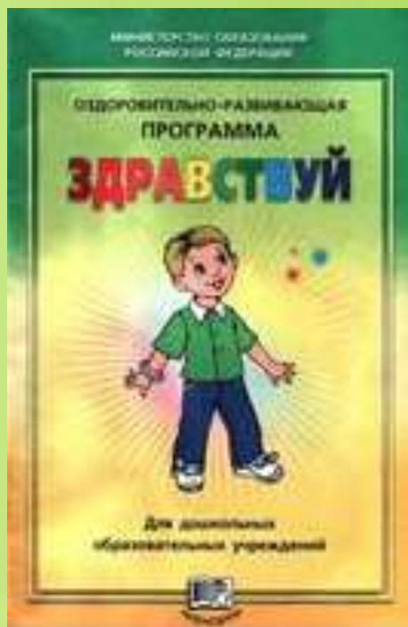
Оздоровительно – развивающая программа «Здравствуй!»