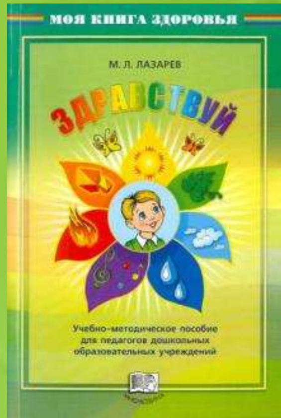
Учебно-методическое пособие для педагогов дошкольных образовательных учреждений